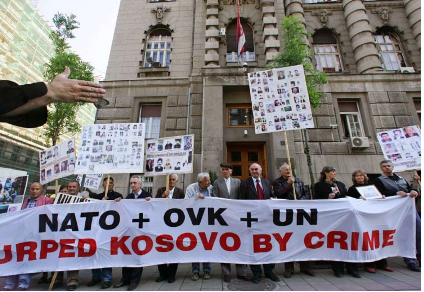
Kosova'yı bugünkü statüsüne taşıyan süreç, NATO'nun Sırlara müdahalesi ile başladı.

İkinci Dünya Savaşı'ndan sonraki devrede kendi kaderini tayin hakkı BM Şartı'nın XII'nci bölümünde (Uluslararası Vesayet Sistemi), 1/2, 55 ve 73. (Kendini Yönetmeyen Ülkelere İlişkin Bildiri) Maddelerinde düzenlenmiştir. Kapsam olarak sınırlı olan bu düzenleme, kendi kaderini tayin hakkının değişik çevrelerde farklı anlamda ve içerikte yorumlanmasına neden olmuştur. Başlangıçta, aralarında Gana, Kamerun, Somali, Tanzanya, Ruanda ve Burundi'nin de yer aldığı 11 ülke vesayet rejimine dahil edilmişlerdir. İşlevi kalmadığında, Vesayet Konseyi'nin düzenli faaliyeti 1 Kasım 1994'de sona ermiştir. 4