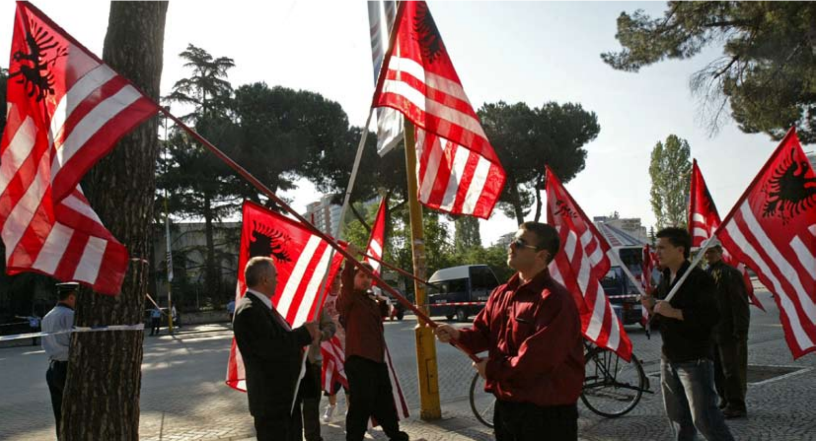
ABD Başkanı Bush'un Arnavutluk ziyareti sırasında bazı Arnavut bayraklarının ABD bayrakları ile aynı tasarımda birleştirildiği görüldü. Bu durum Balkanlardaki Arnavutların ABD algılaması açısından önemli bir gösterge.

bistan arasında 14 Mart 2002'de imzalanan "Belgrad Anlaşması" gereğince, 4 Şubat 2006'dan sonra hem Sırbistan'ın, hem de Karadağ'ın bağımsızlık için halk oylaması düzenleme hakkı bulunmaktaydı. Bu hak, Belgrad Anlaşması'na uygun olarak hazırlanan Sırbistan ve Karadağ Anayasası'nın 60'ıncı maddesinde ifadesini bulmuştur. 22 Dolayısıyla, yukarıda adı geçen ve yasal anlamda kendi kaderini belirleme hakları bulunmayan bölgelerin, Karadağ'ı kendilerine model almalarının hukuki açıdan savunulamayacağı söylenebilir. Bu genel tespitten sonra, aşağıda Kosova'ya özel durum daha ayrıntılı olarak incelenecektir.