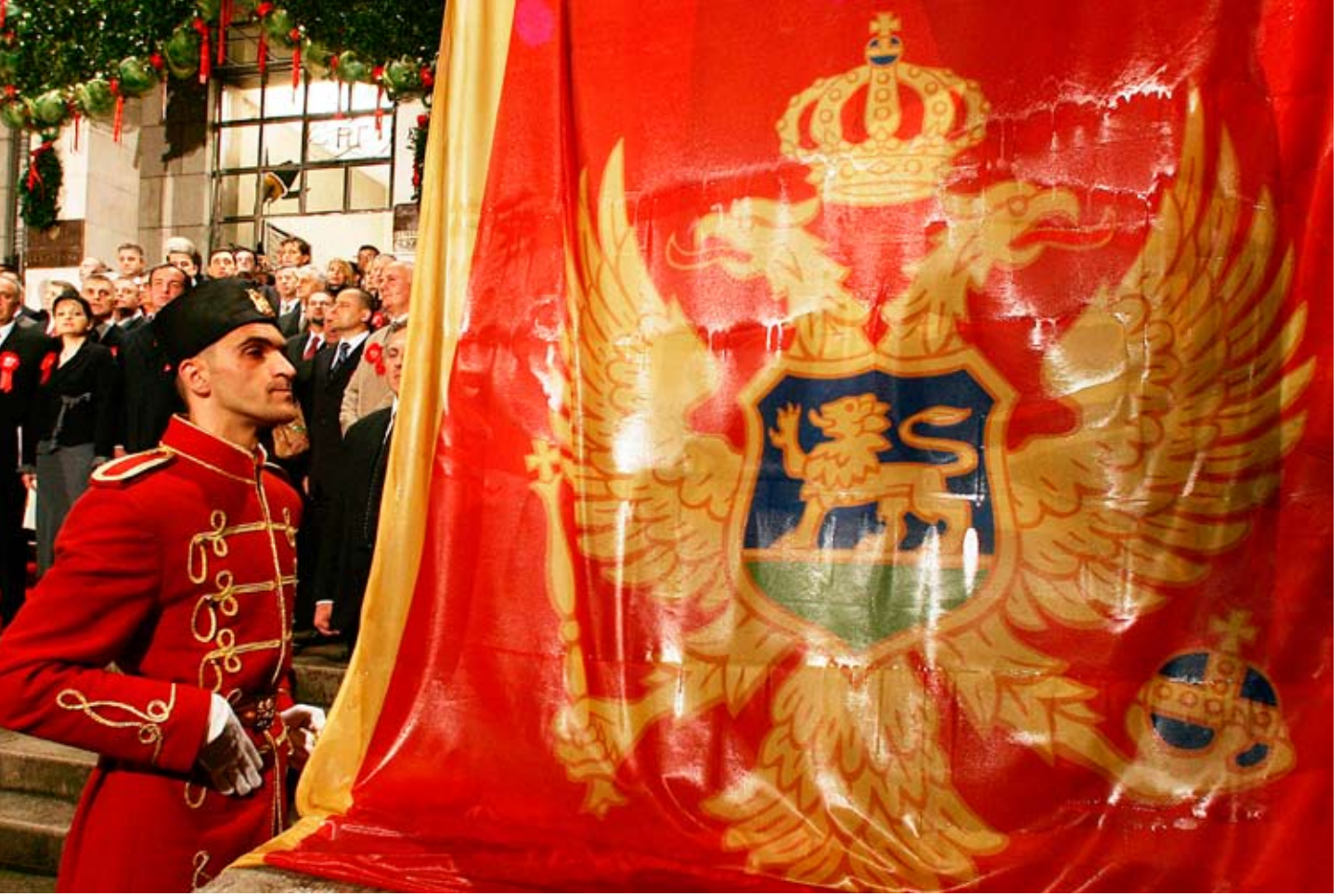
Karadağ'ın bağımsızlığı, bazı bölgelerin bağımsızlık rüyası kurmasına neden oldu. Ancak Karadağ zaten uzun süredir bu yasal hakka sahipti. Şimdi "yeni umut" Kosova.

Diğer taraftan, Dağlık Karabağ "Devlet Başkanı" Arkady Gukasyan, Karadağ'ın bağımsızlığının, Karabağ sorununun çözümüne de emsal teşkil ettiğini açıklamada gecikmemiştir. 13 Aslında bu tür açıklamalar, adı geçen sorunlu bölgelerin bir an önce bağımsız olabilme/tanınabilme arzularının bir yansımasından başka bir şey değildir. Oysa, bunlardan farklı olarak, Karadağ'ın yasal anlamda bağımsızlığını ilan etme hakkı zaten mevcut idi. Bunu sağlıklı bir şekilde değerlendirebilmek için, 1990'ların başlarında dağılan Yugoslavya Sosyalist Federal Cumhuriyeti'ne (YSFC) ve bu ülkenin Anayasası'na bakmakta fayda vardır.