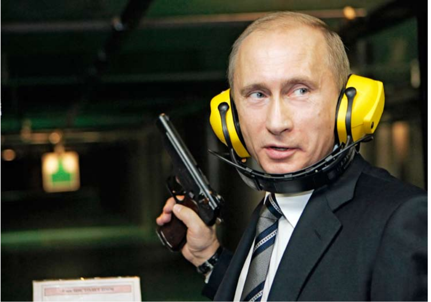
Rusya, Kosova meselesini Batı'ya karşı bir silah olarak kullanmaya çalışıyor ve Kosova'nın bağımsızlığının tanınması durumunda kendisinin de Abhazy ve Güney Osetya'yı tanıyabileceğini bildiriyor.

Birliği sınırları içinde dört adet dondurulmuş çatışma bölgesi bulunmaktadır. Bunlar Moldova'dan ayrılmayı talep eden Transdinyester (Pridnistrovye), Gürcistan'dan ayrılmayı talep eden Abhazy ve Güney Osetya, Azerbaycan'dan ayrılmayı talep eden Dağlık Karabağ'dır. Karadağ'ın bağımsızlığının tanınması ve Kosova'ya da bu yolun açılması bu bölgelerin bağımsızlık taleplerini cesaretlendirmektedir.