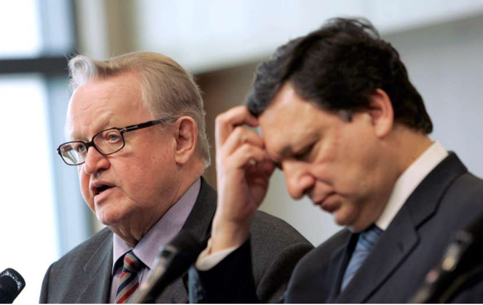
BM Kosova Özel Temsilcisi Marti Ahtisaari (solda), Kosova'nın statüsü üzerine hazırladığı nihai raporunda, bölgeye uluslararası toplum tarafından denetlenen bir bağımsızlığın tanınmasını önerdi. Rapor, ABD ve AB'den geniş destek bulmuştu.