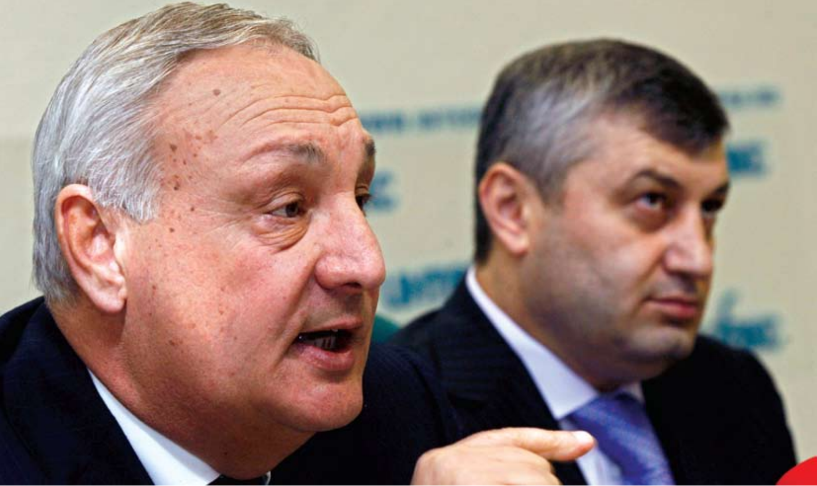
Abhazya lideri Sergey Bagapş (solda), Kosova'nın bağımsızlığını ilan etmesinin hemen ardından Moskova'da Güney Osetya lideri Eduard Kokoity ile bir basın toplantısı düzenlemiş ve tanınma taleplerini değerlendirmişti.

"Güç gelince adalet gider" Gürcü Atasözü