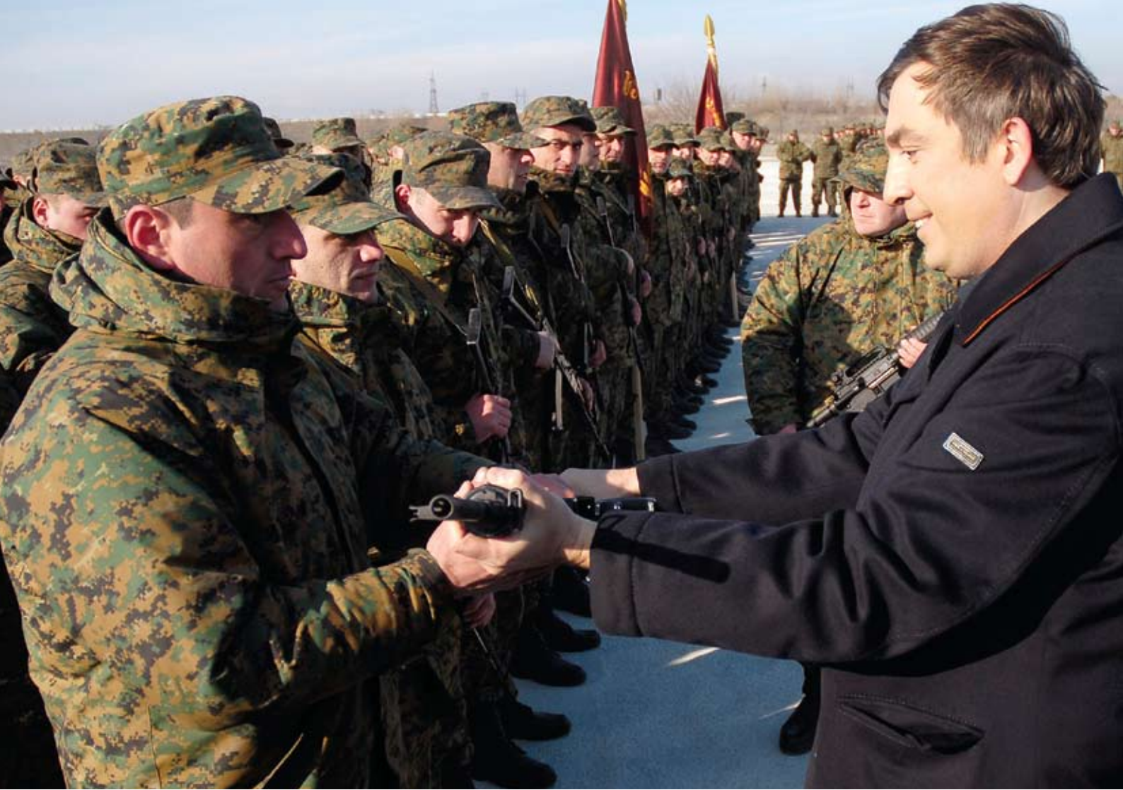
Abhazy ve Güney Osetya'nın bağımsızlık taleplerinin daha fazla destek görmesiyle birlikte, Gürcistan merkezi yönetimi ile bu bölgeler arasındaki çatışmalar tekrar başlayabilir.

ambargonun insani ölçülere çekilmesini istemektedir. Türkiye de Gürcistan'ın Abhazy'ya yönelik bu kısıtlamalarının insani ölçülere çekilmesi konusunda hemfikirdir. Ayrıca Ankara, Türkiye ile Abhazy arasındaki ticari ve insani ilişkilerin, en azından Gürcistan ile Abhazy arasındaki mevcut ilişkiler kadar olmasını arzu etmektedir. Değişim ve kimlik isteminde ısrarcı olan Abhazy'nın tarihî, kültürel ve akrabalık bağlarının bulunduğu Türkiye ile ilişkilerini yeniden geliştirmek için atağa geçmesi, Abhazy-Türkiye ilişkilerinin geleceğinin belirlenmesi bakımından önem taşımaktadır. Nitekim, Abhazy iktidarı ve halkı üzerinde büyük etkisi olan 'Dünya Abhaz-Abazin (Abaza) Halkları Birliği'nin 11 Haziran 2005'de Türkiye'de (Sakarya-Hendek)